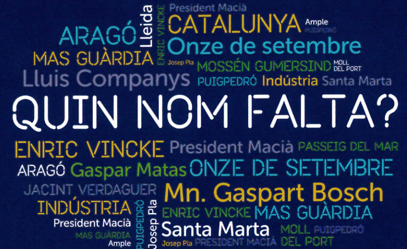
CARRERS A, B, C