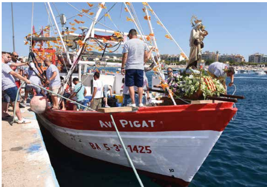
La barca Avi Pigat amb la imatge de la patrona, juliol 2022

12 h Església de Santa Maria del Mar de Palamós Missa Solemne amb la participació de la coral de la parròquia de Santa Maria.