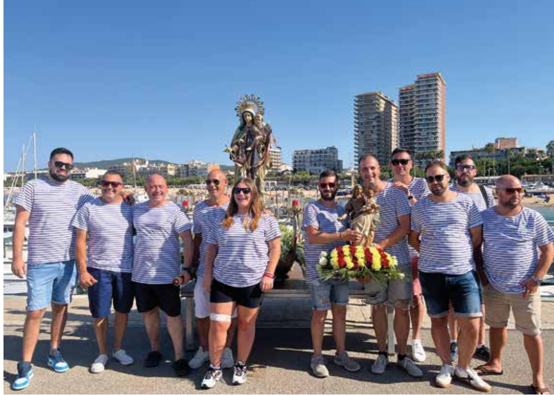
El grup de "portadors" al Moll Vell, juliol 2022

23 h Esplanada de la Llotja Ball de revetlla amb la Band Gogh .