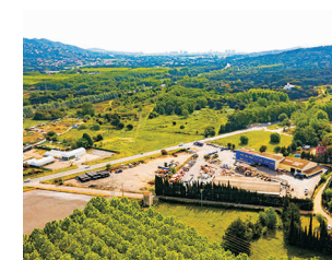
SANTA CRISTINA D'ARO