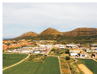
TORROELLA DE MONTGRÍ