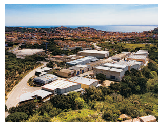
SANT FELIU DE GUÍXOLS