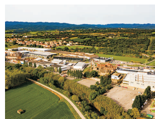
LA BISBAL D'EMPORDÀ