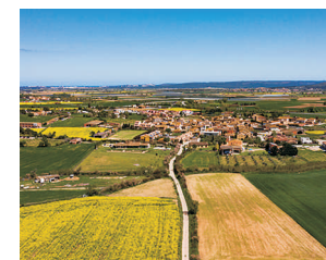
LA TALLADA D'EMPORDÀ