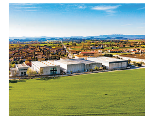
SERRA DE DARÓ