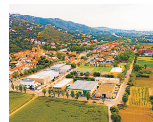
PLATJA D'ARO - CASTELL D'ARO