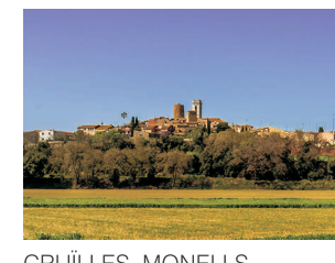
CRUÏLLES, MONELLS I SANT SADURNÍ DE L'HEURA