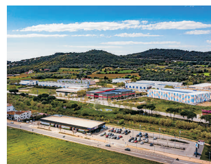
CALONGE I SANT ANTONI